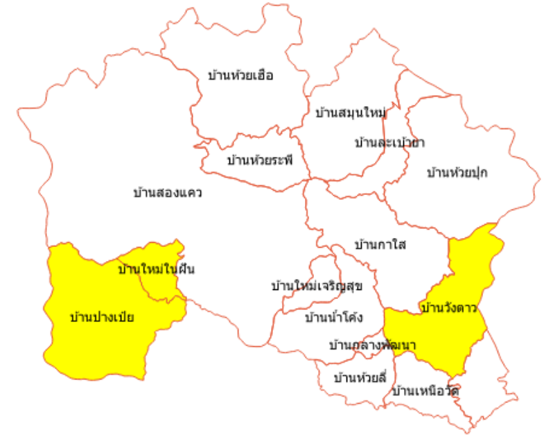
ตำบลเมืองจ๋อง อำเภอภูเพียง