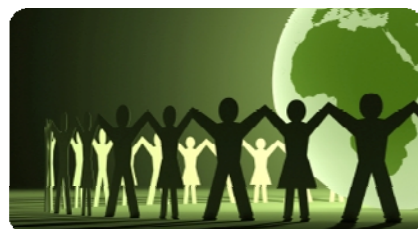
EnT Opening Day [20]

ประธานคณะกรรมการอำนวยการ Engagement Thailand